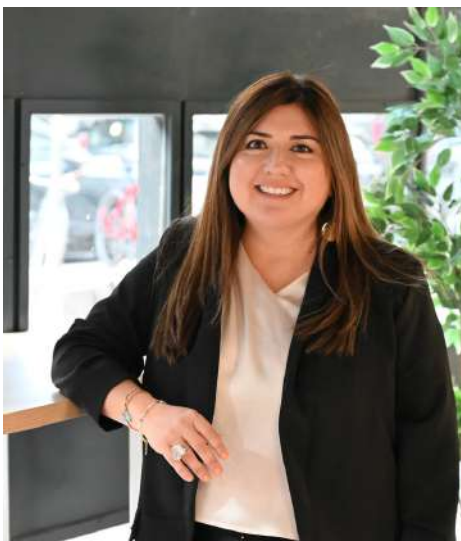
Directora Académica y Servicios Estudiantiles