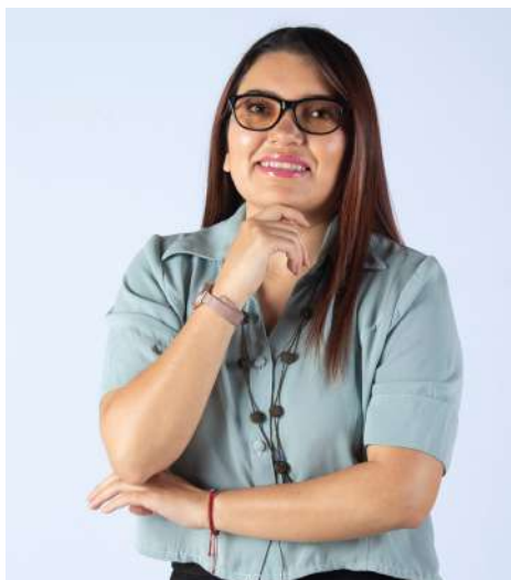
Equipo GAIAS Europa - Quito