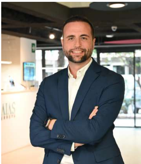
Director GAIAS Europa