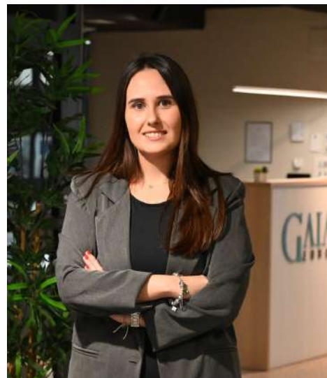
Especialista de Programas Académicos.