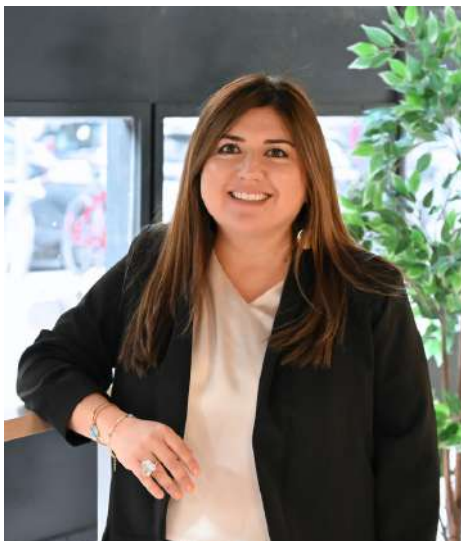
Directora Académica y Servicios Estudiantiles