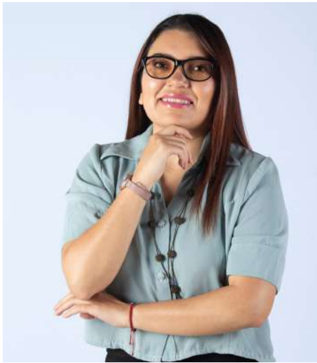
Equipo GAIAS Europa - Quito