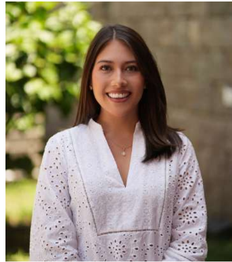
Equipo GAIAS Europa - Quito