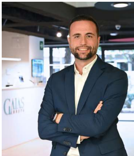
Director GAIAS Europa