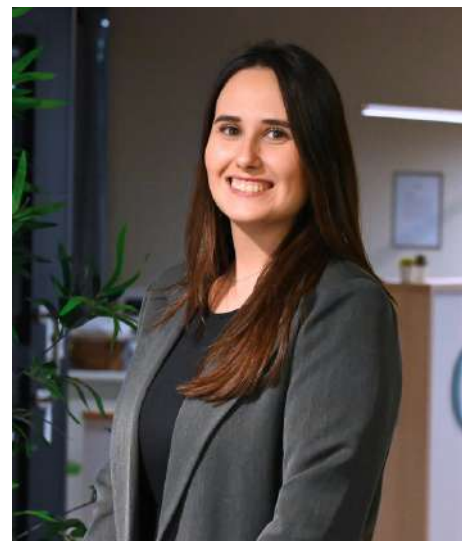
Especialista Programas Académicos