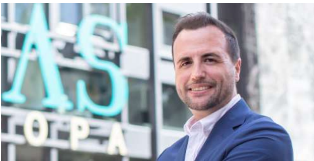
Director GAIAS Europa