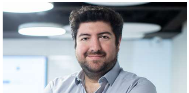
Coordinador de TI y Operaciones