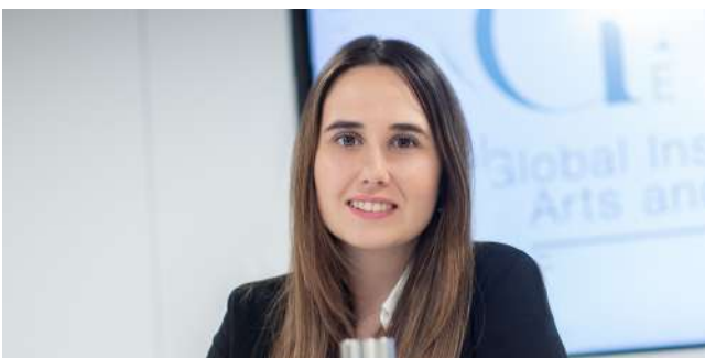
Analista de Administración