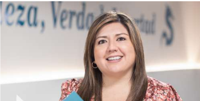
Directora Académica y Servicios Estudiantiles.