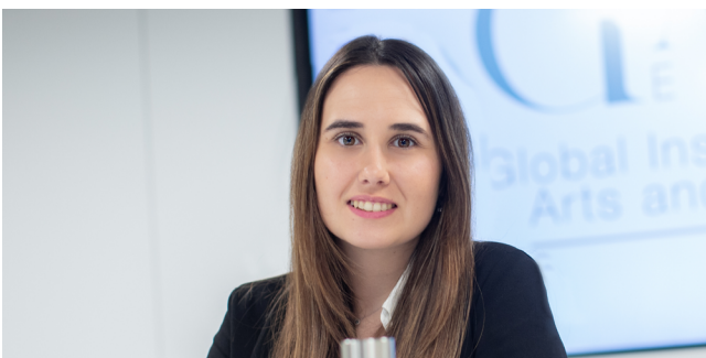
Analista de Administración