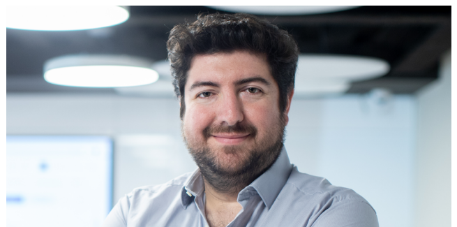
Coordinador de TI y Operaciones