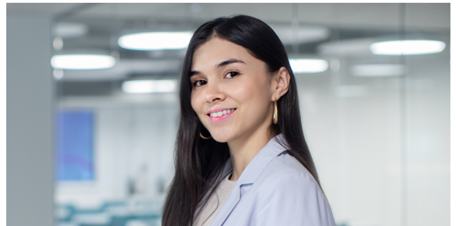
Analista de Servicios Estudiantiles