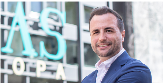
Director GAIAS Europa