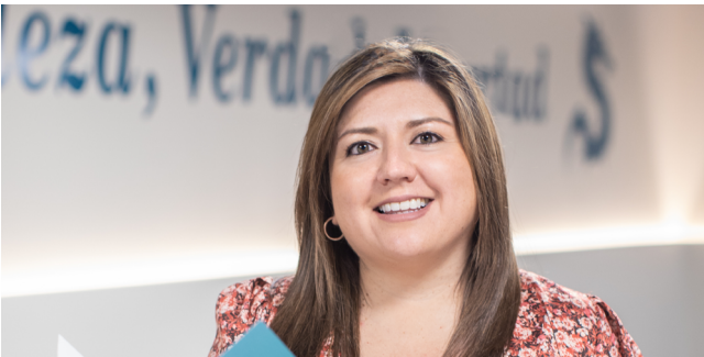
Directora Académica y Servicios Estudiantiles.