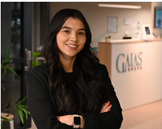
Analista de Servicios Estudiantiles