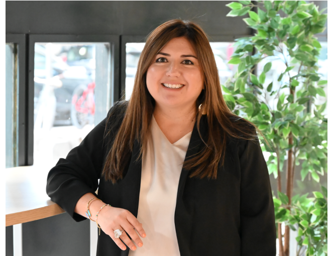
Directora Académica y Servicios Estudiantiles