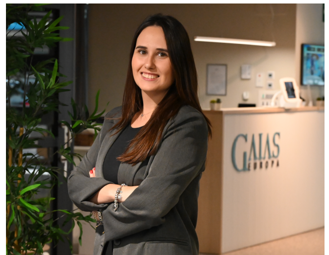
Especialista Programas Académicos

Todos nuestros tutores y profesores son profesionales altamente cualificados.