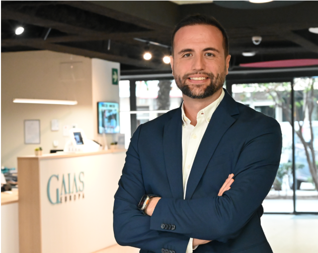
Director GAIAS Europa